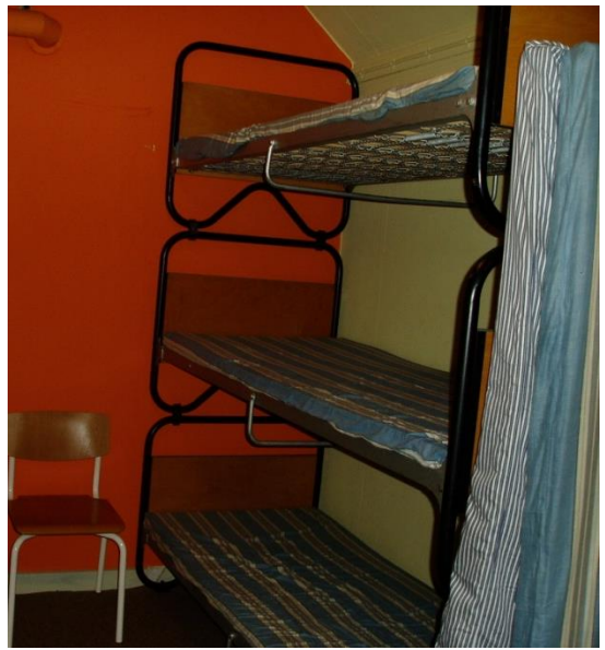
Foto til venstre: opholdsrum. Foto til højre: køjer i tre etager.