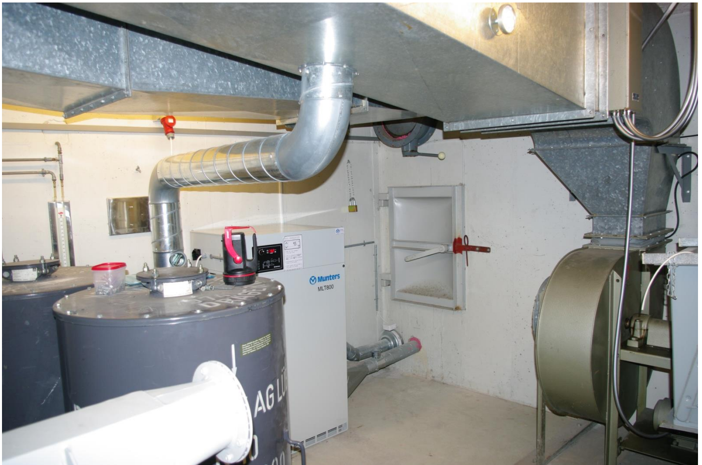
Ventilationsanlæg, gasfiltre og nødudgang.