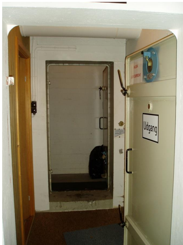
Foto til venstre: hegn omkransede bunkeren. Foto til højre: panserdør yderst og gastæt dør inderst.