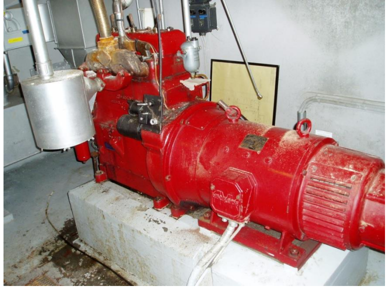
Ventilationsanlæg og nødgenerator.

Beredskabsstyrelsen nedlagde bunkeren i 2001 og i 2003 bad de Forsvarets Bygningstjeneste rive bunkeren ned, da grunden skulle tilbageleveres til Aarhus kommune i samme stand, som da den blev lejet.