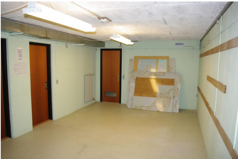
Møderum i bunkeren.