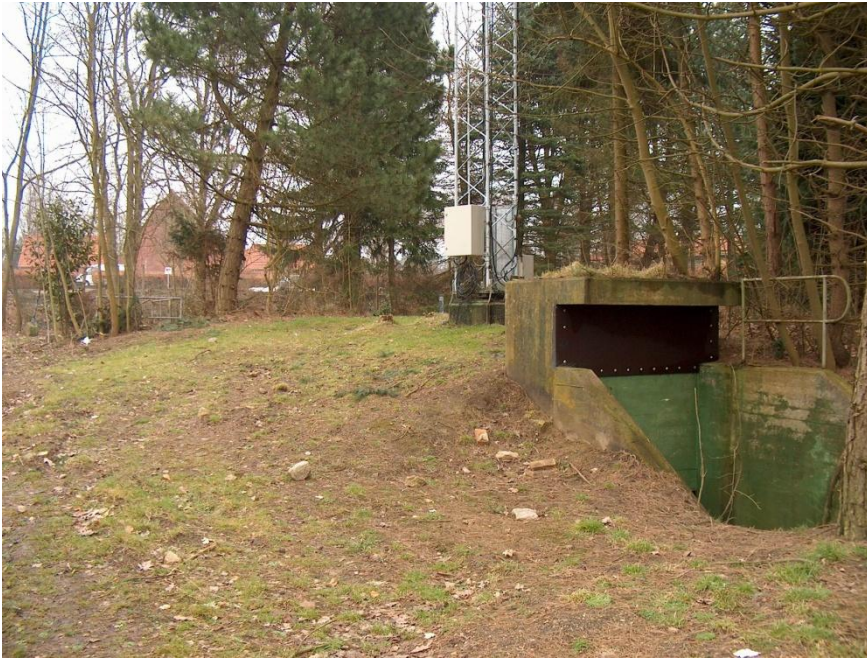
På et tidspunkt efter krigen er indgangspartiet blevet overdækket og derfor ser terrænet lidt anderledes ud i dag. Foto venligst udlånt af Tønnes Schrøder 2011.