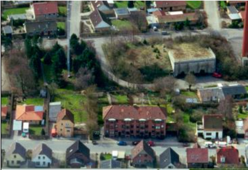
Regionsbunkeren ligger til venstre under masten. Den kommunale kommandocentral ses til højre.

Tyskerne byggede både en underjordisk afdeling af deres telefon- og fjernskrivertjeneste samt en forstærkerstation, der havde til formål at forbedre taletydigheden på det tyske telefonnet.