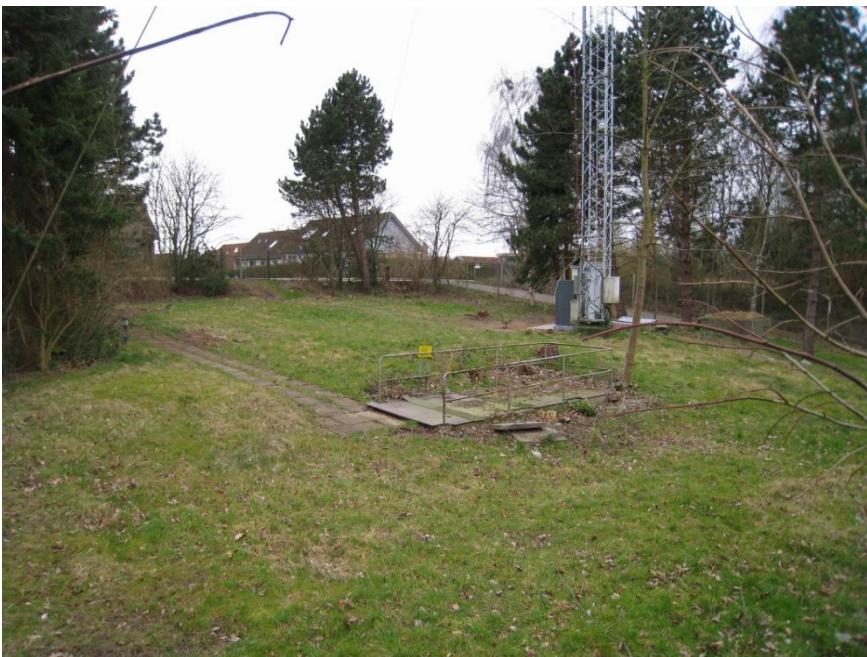
Nødudgangen. I baggrunden ses masten og til højre for den, ses hovedindgangen.

Kilder: http://www.kolding.dk/data/0019949.asp?sid=19725&uid=19739 , http://www.gyges.dk/mystery_bunker_in_kolding.htm , http://www.gyges.dk/Kolding_Forstrkerstation.pdf og interview med Beredskabsinspektør Finn Hansen.