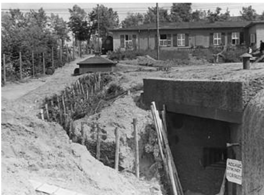
Billedtekst: bunkeren, som den så ud lige efter befrielsen 1945. Indgangen er på højre side af det nærkampskydeskår, der ses på billedet.

Bunkeren er bygget af den tyske besættelsesmagt (typenummer FL250) fra maj 1944 til april 1945.