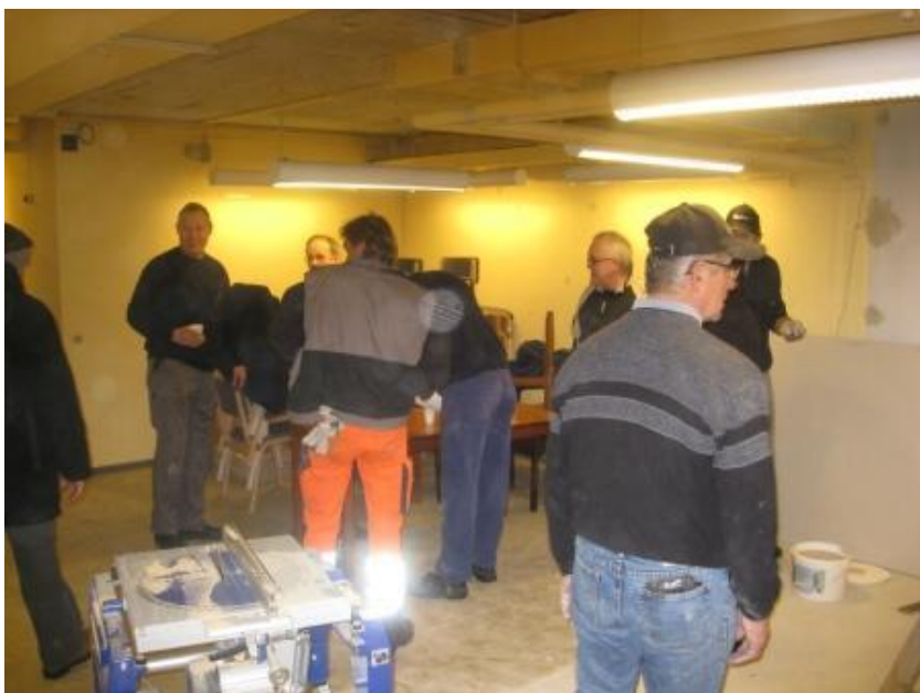
De sikrede faciliteter indrettes under politistationen indrettes.