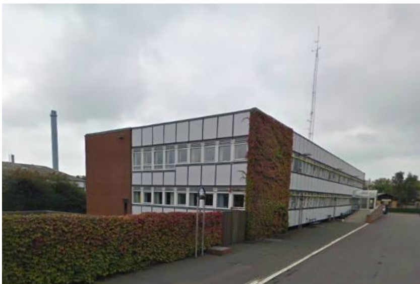
Politistationen i Rønne 2011.

Efter at politistationen på Zahrtmannsvej 44 i Rønne blev opført i 1979 kunne politiregionen, civilforsvarsregionen (fra 1992 kaldet beredskabsregion) og civilregionen (og dermed regionsledelsen) fungere fra et sikret rum under politistationen. Bunkerer under Rø skole blev fra da af brugt som lokaler for ungdomsklubben.