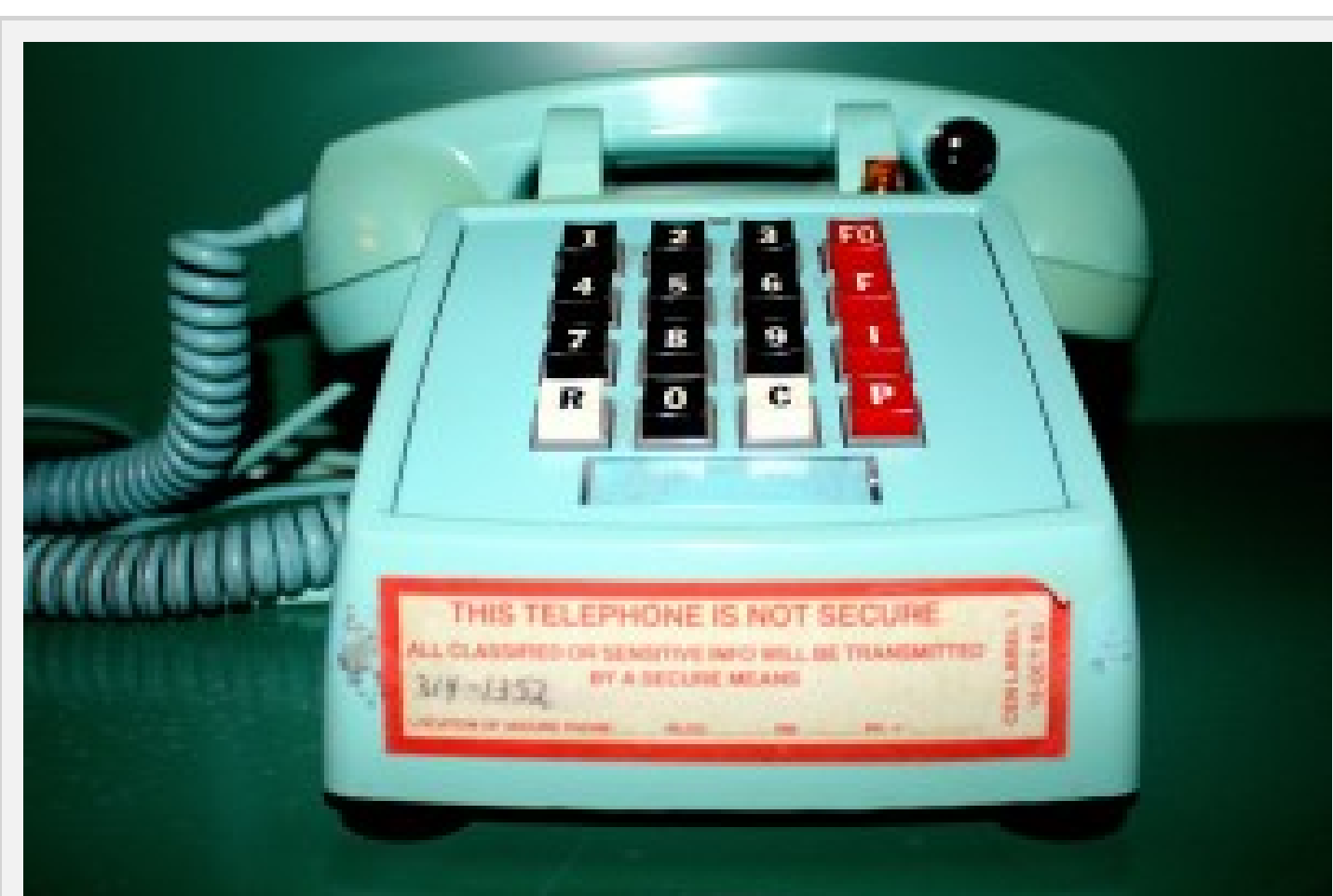
Telefon som ikke er sikkerhedsgodkendt fra bunkeren Regan Vest. Alt skulle kunne fungere under selv kritiske forhold, og det var vigtigt at man kendte hemmelighedsniveauet.

Undertegnede anmelder vil argumentere for, at uddrag af bogen, bør være obligatorisk læsning for gymnasieelever i fremtiden. For desværre vil man nok se at den sjældne viden som bogen indeholder, vil gå tabt hvis ikke der bliver taget aktivt hånd om at vidensdele den. Og dét er Danmarks historie for vigtig til.