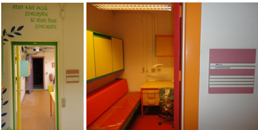
Poul Gernes udsmykkede bunkeren og valgte alle farver.