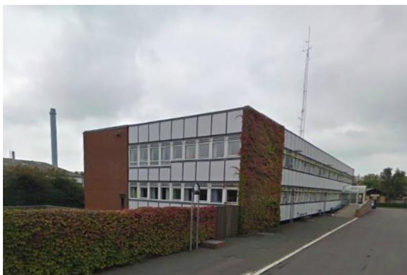
Politistationen i Rønne 2011.

Efter at politistationen på Zahrtmannsvej 44 i Rønne blev opført i 1979 kunne politiregionen, civilforsvarsregionen (fra 1992 kaldet beredskabsregion) og civilregionen (og dermed regionsledelsen) fungere fra et sikret rum under politistationen. Bunkerer under Rø skole blev fra da af brugt som lokaler for ungdomsklubben.