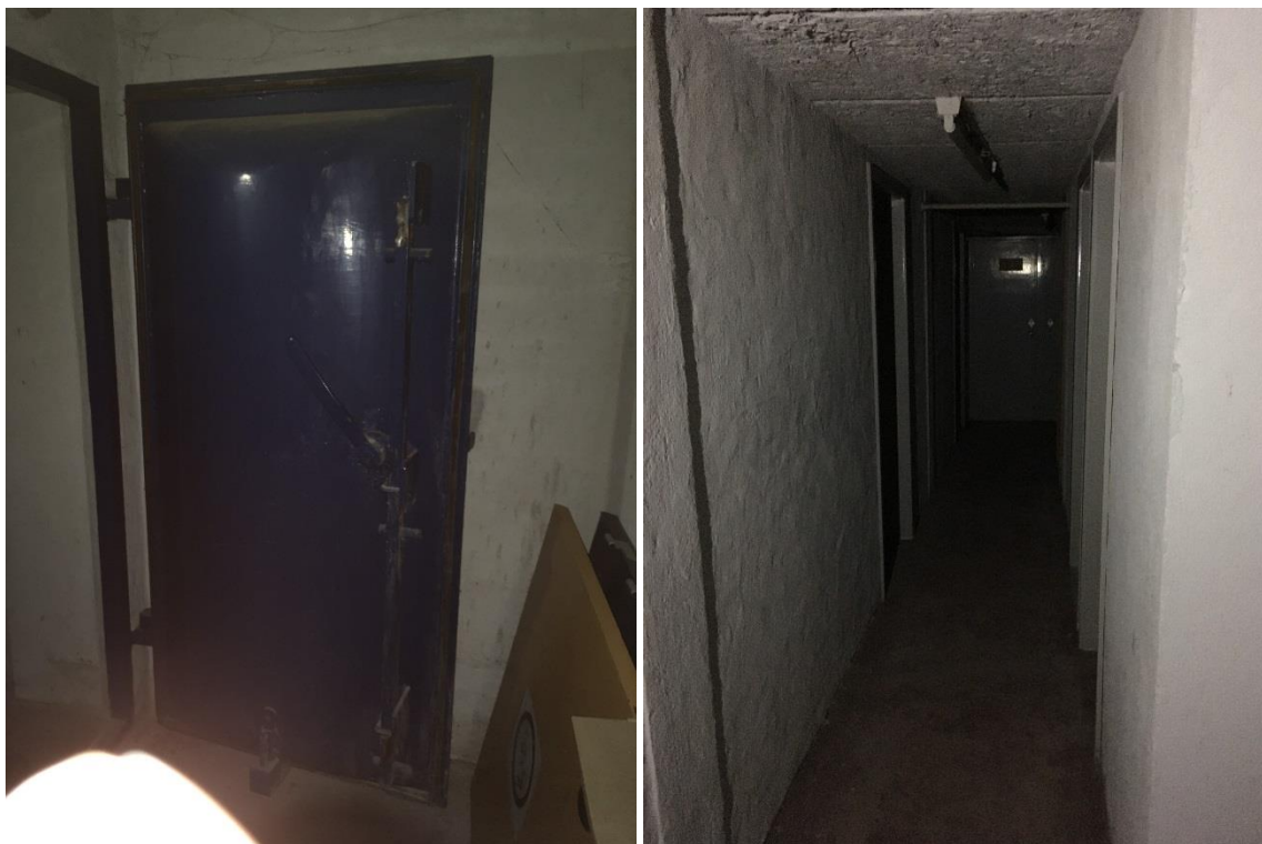
Panserdør og fordelingsgangen. Foto: Poul Holt Pedersen 2017.

Efter at politistationen på Zahrtmannsvej 44 i Rønne blev opført i 1979 kunne politiregionen, civilforsvarsregionen (fra 1992 kaldet beredskabsregion) og civilregionen (og dermed regionsledelsen) fungere fra et sikret rum under politistationen. Bunkerer under Rø skole blev fra da af brugt som lokaler for ungdomsklubben.